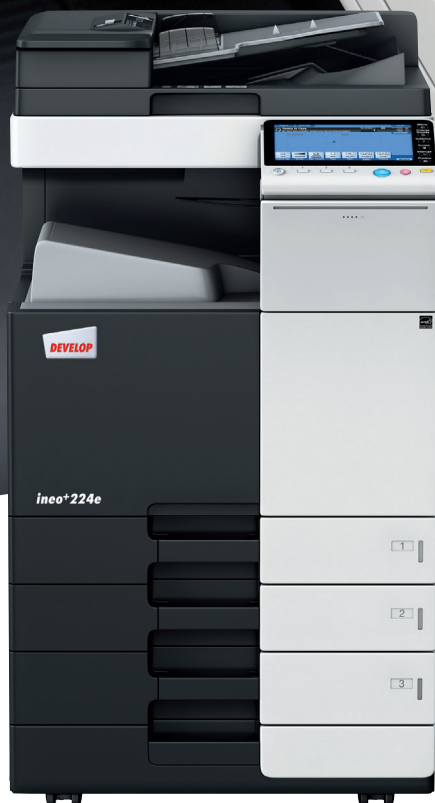
ineo+ 224e z podajnikiem papieru (PC-210) i podajnikiem oryginałów (DF-701)