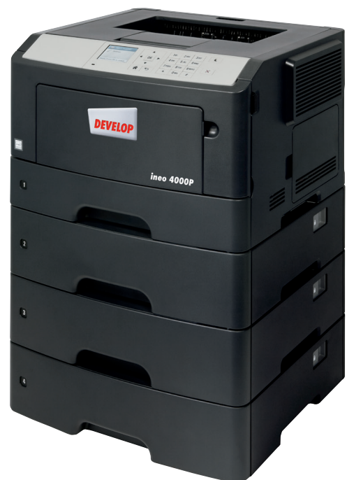
ineo 4000P z trzema dodatkowymi podajnikami papieru (PF-P12)

Jeżeli skomplikowany system operacyjny Twojej obecnej drukarki nie ułatwia Ci pracy, a samo urządzenie jest trudne w obsłudze, czas, aby pomyśleć o zmianie na ineo 4000P. Kolorowy wyświetlacz o przekątnej 2,4 cala zapewnia intuicyjną obsługę, a podświetlane menu informuje użytkownika o stanie systemu, opcjach pracy i ustawieniach. Co więcej, nawigacja oparta na układzie folderów gwarantuje, że ineo 4000P jest dużo łatwiejsze w obsłudze niż inne systemy. Dzięki temu, Ty i Twój pracownicy oszczędzacie czas i wysiłek podczas codziennego drukowania dokumentów. Co więcej, aby korzystać z tej nowej drukarki, nikt nigdy nie będzie musiał zaglądać do instrukcji obsługi.